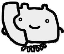
マスコット にこりん

電話 045-664-2525 FAX 045-664-2828 受付 8時～21時 (土日祝日を含む毎日)