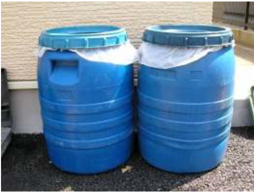
(町内会館前の廃油回収ボックス) (川上地域エコ活動委員会)