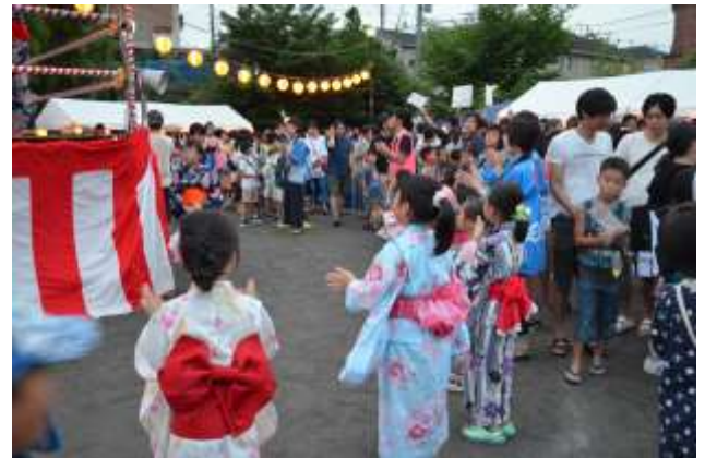
30日は踊りの輪が広がった