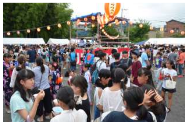
大盛況の会場 このほか会場横の道路も封鎖して会場の一部として使用(30日)