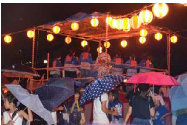
雨の中スケジュール変更して踊り実施(29日)