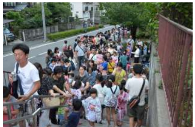
売店の列が公園外まで伸びた(30日)