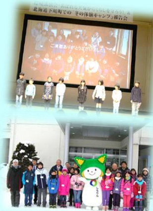
* 昨年の報告会と北海道下川町で行われた冬の体験キャンプでの子どもたち